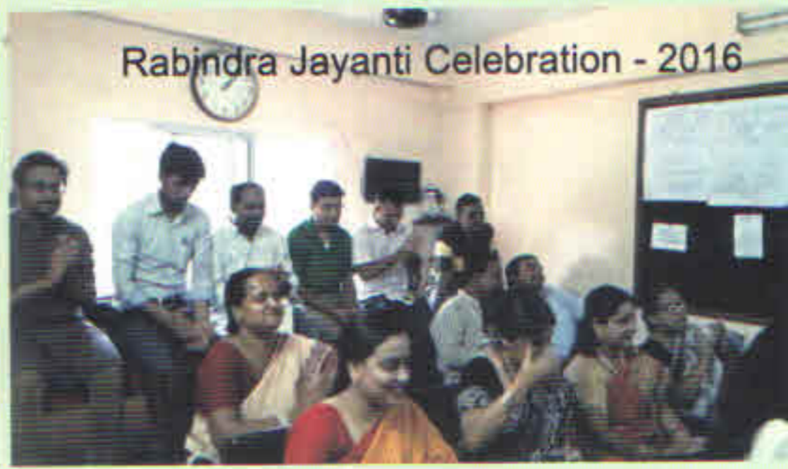
Rabindra Jayanti Celebration - 2016