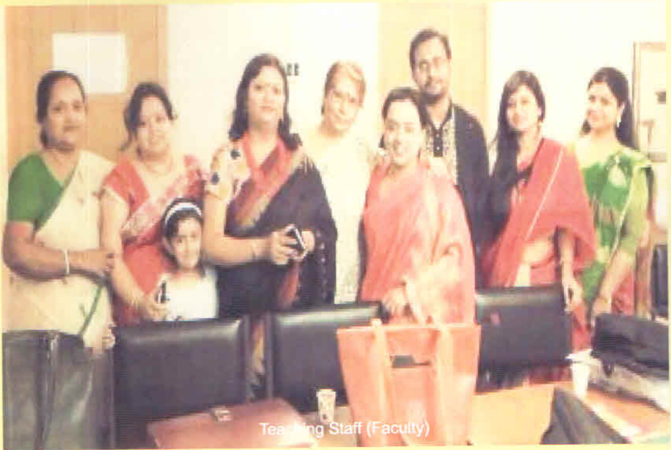
Teaching Staff (Faculty)