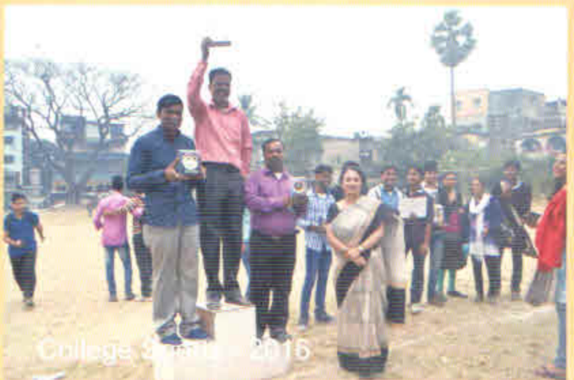
College Sports - 2016