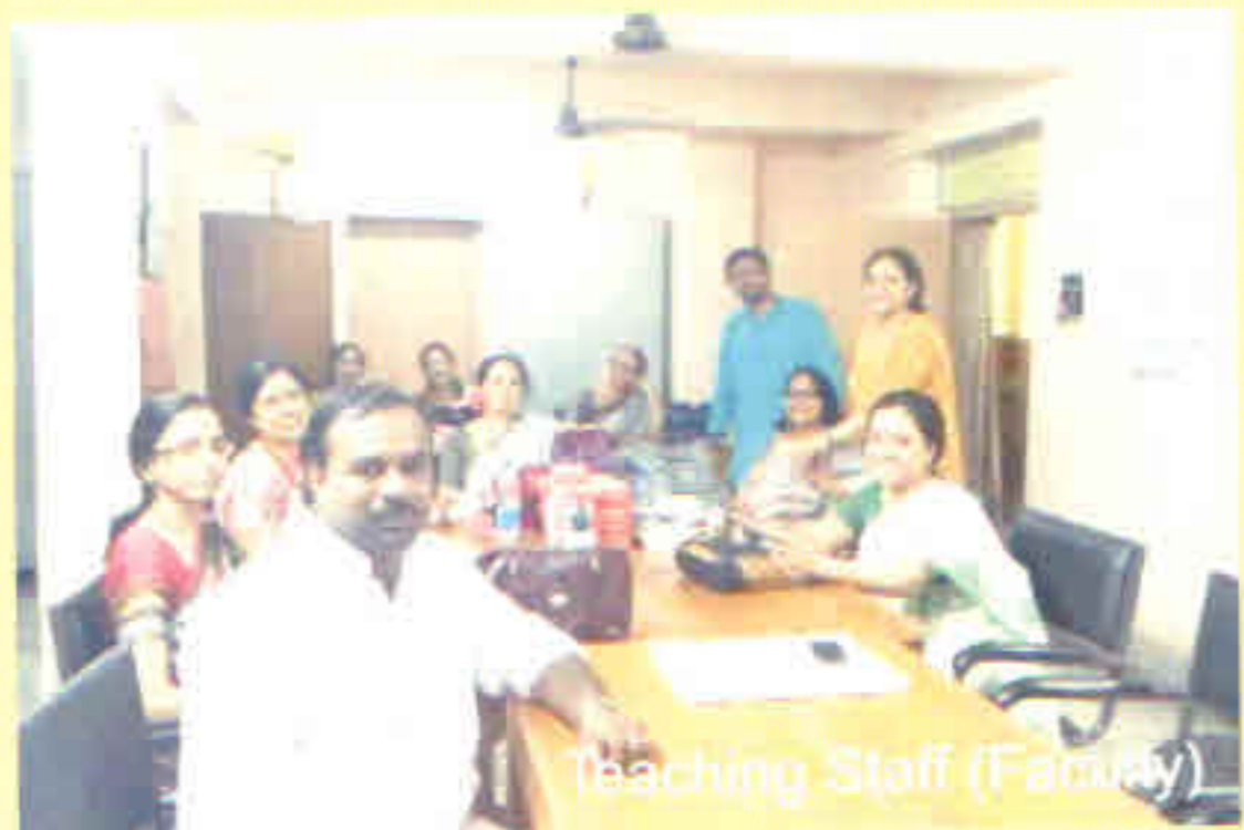
Teaching Staff (Faculty)