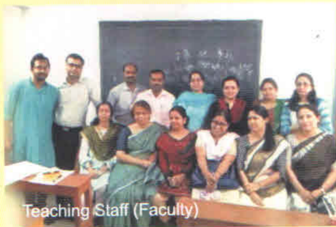
Teaching Staff (Faculty)