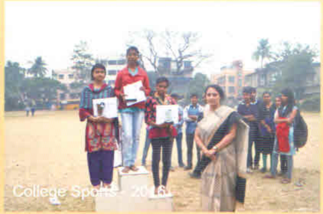
College Sports - 2016