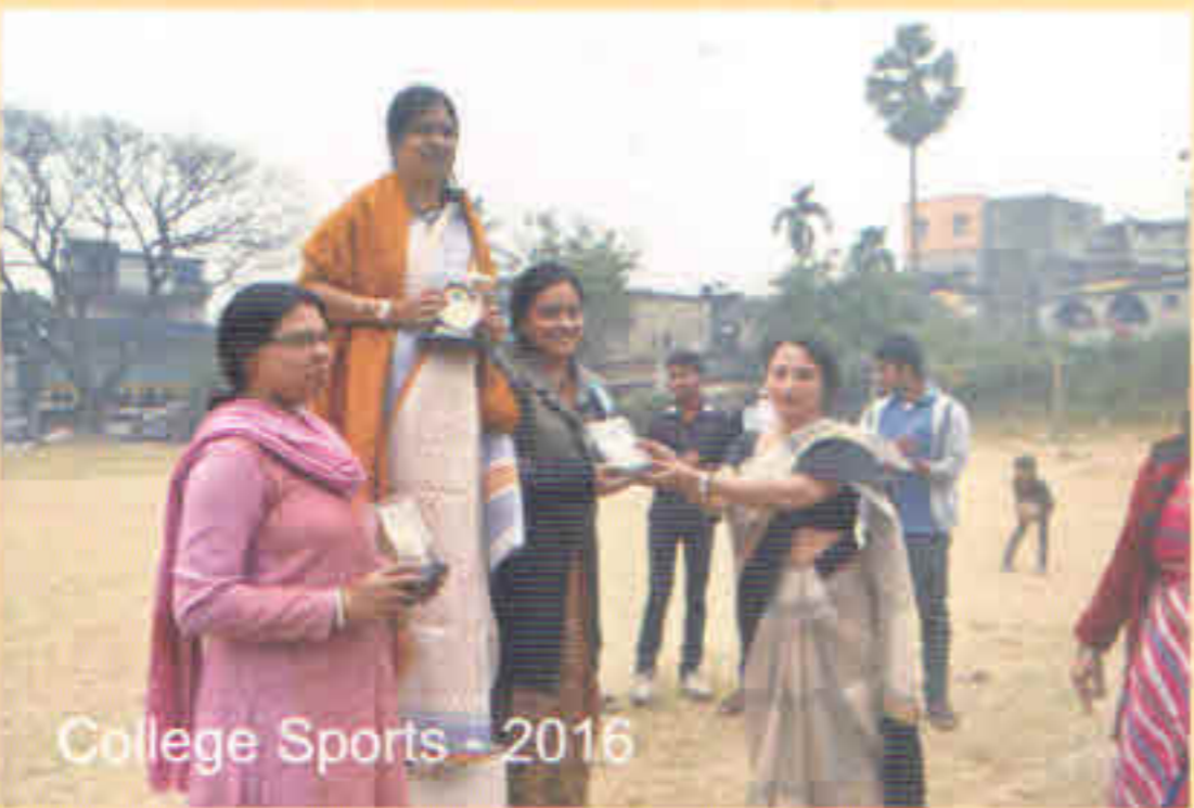
College Sports - 2016