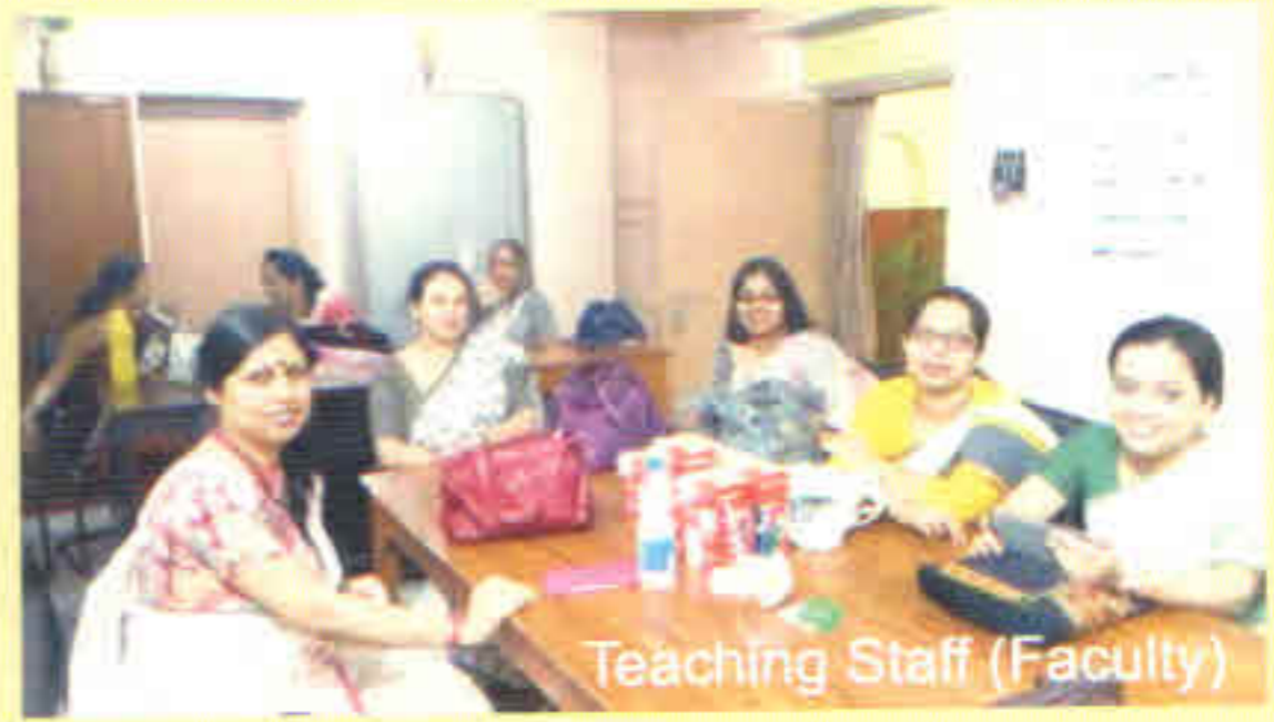
Teaching Staff (Faculty)