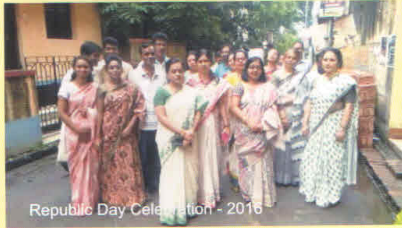
Republic Day Celebration - 2016