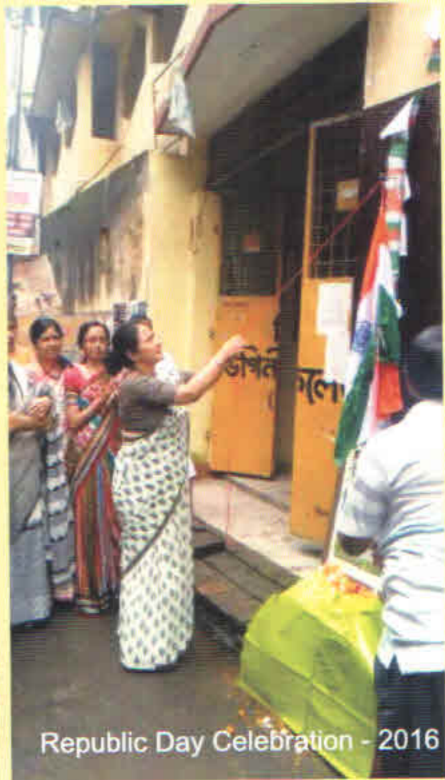
Republic Day Celebration - 2016