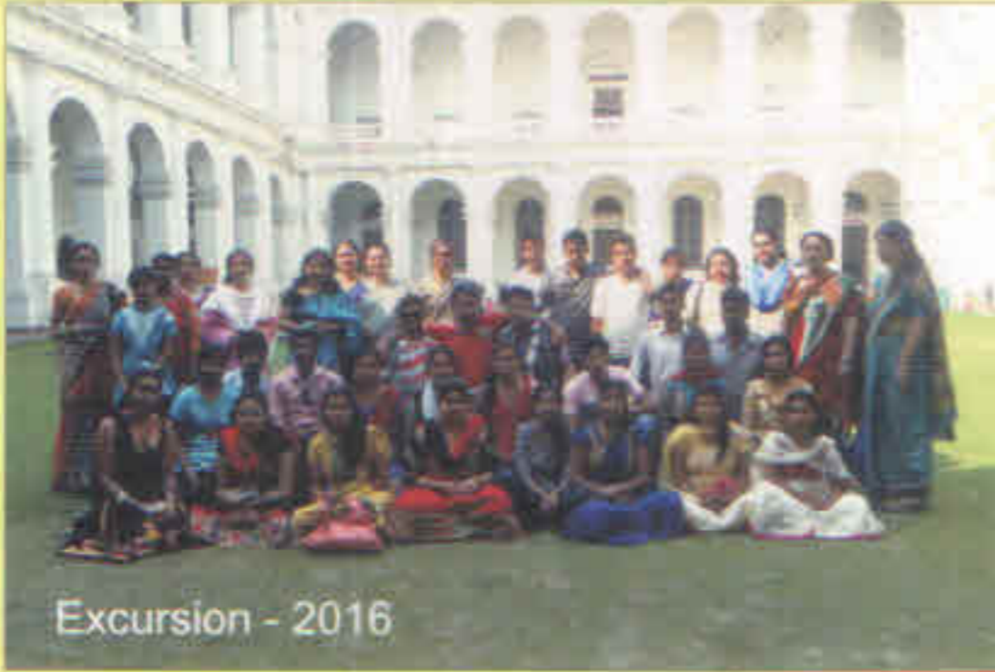
Excursion - 2016