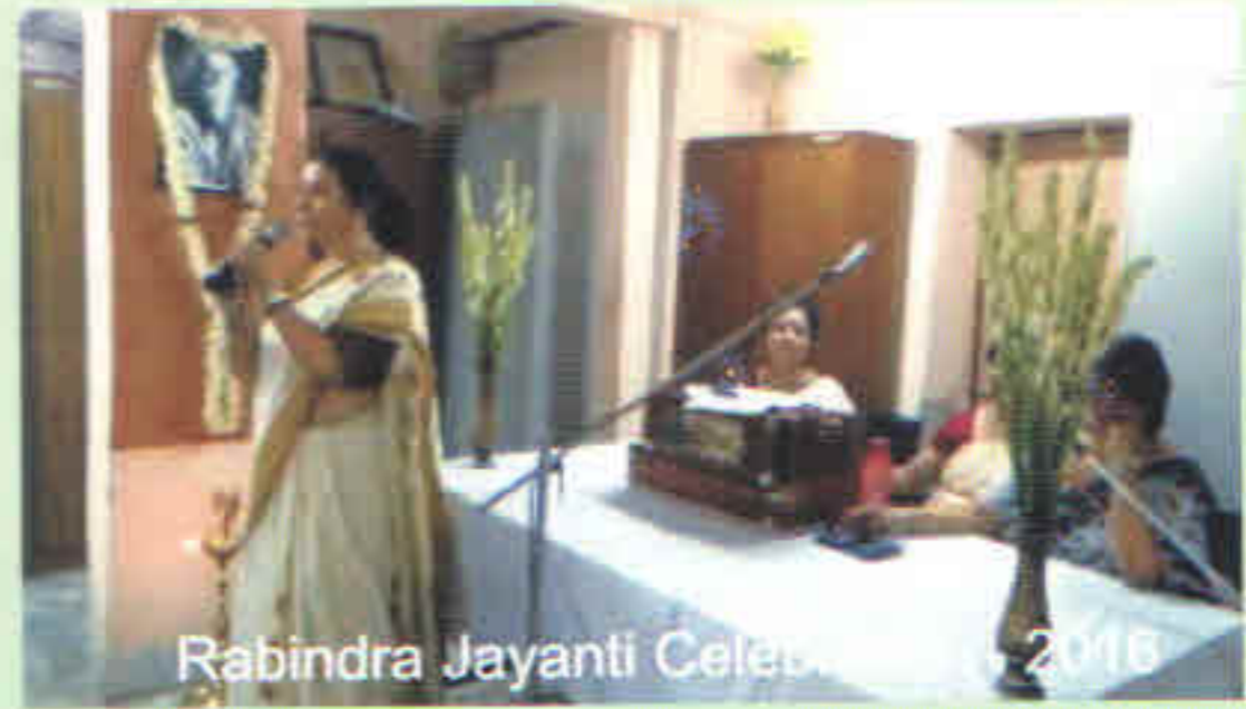
Rabindra Jayanti Celebration - 2016