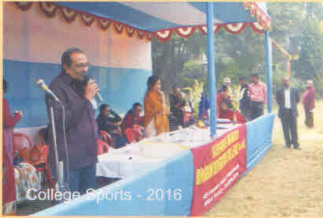
College Sports - 2016