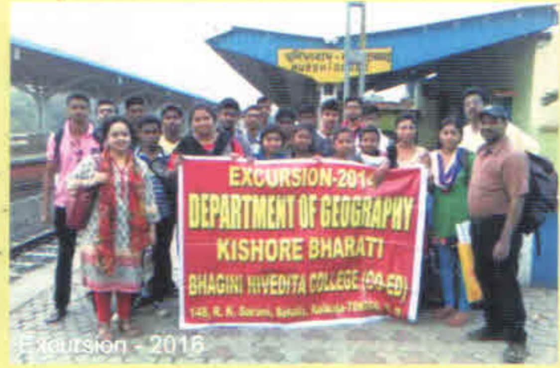
Excursion - 2016