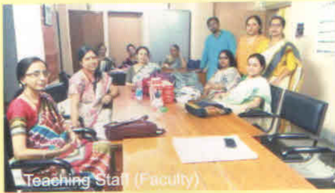
Teaching Staff (Faculty)