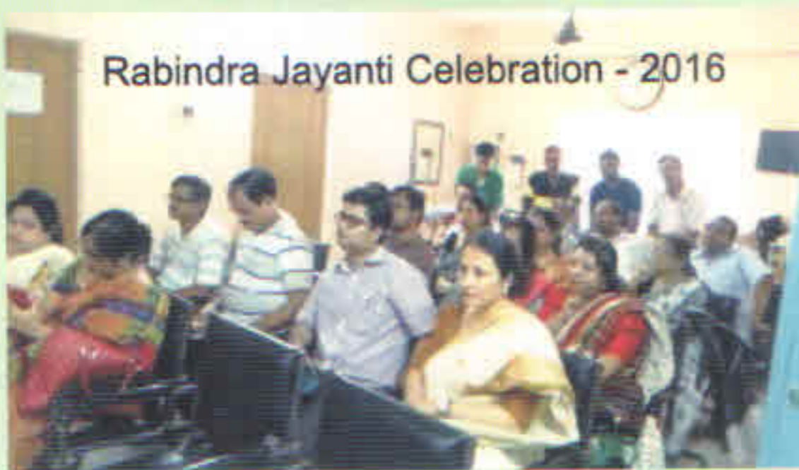
Rabindra Jayanti Celebration - 2016