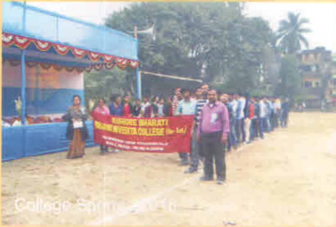
College Sports - 2016