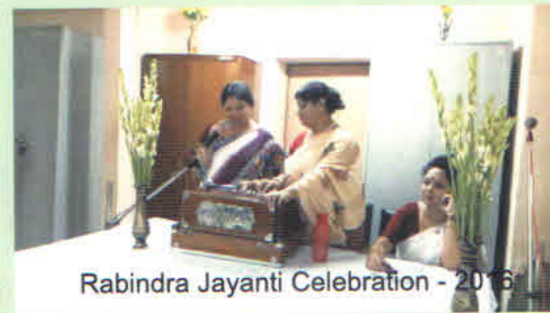
Rabindra Jayanti Celebration - 2016