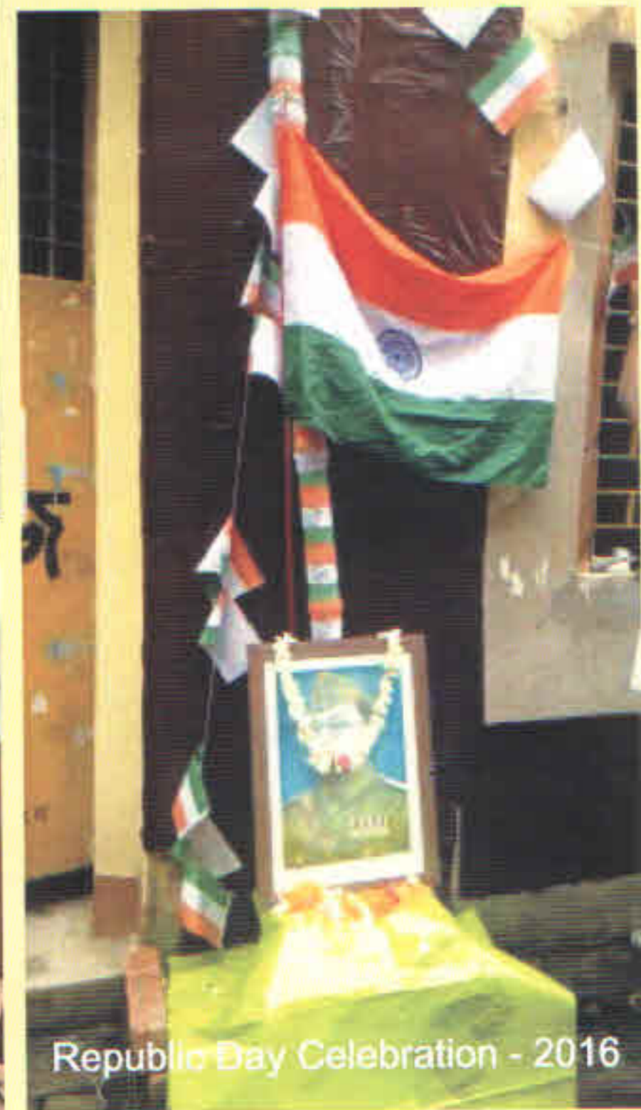
Republic Day Celebration - 2016