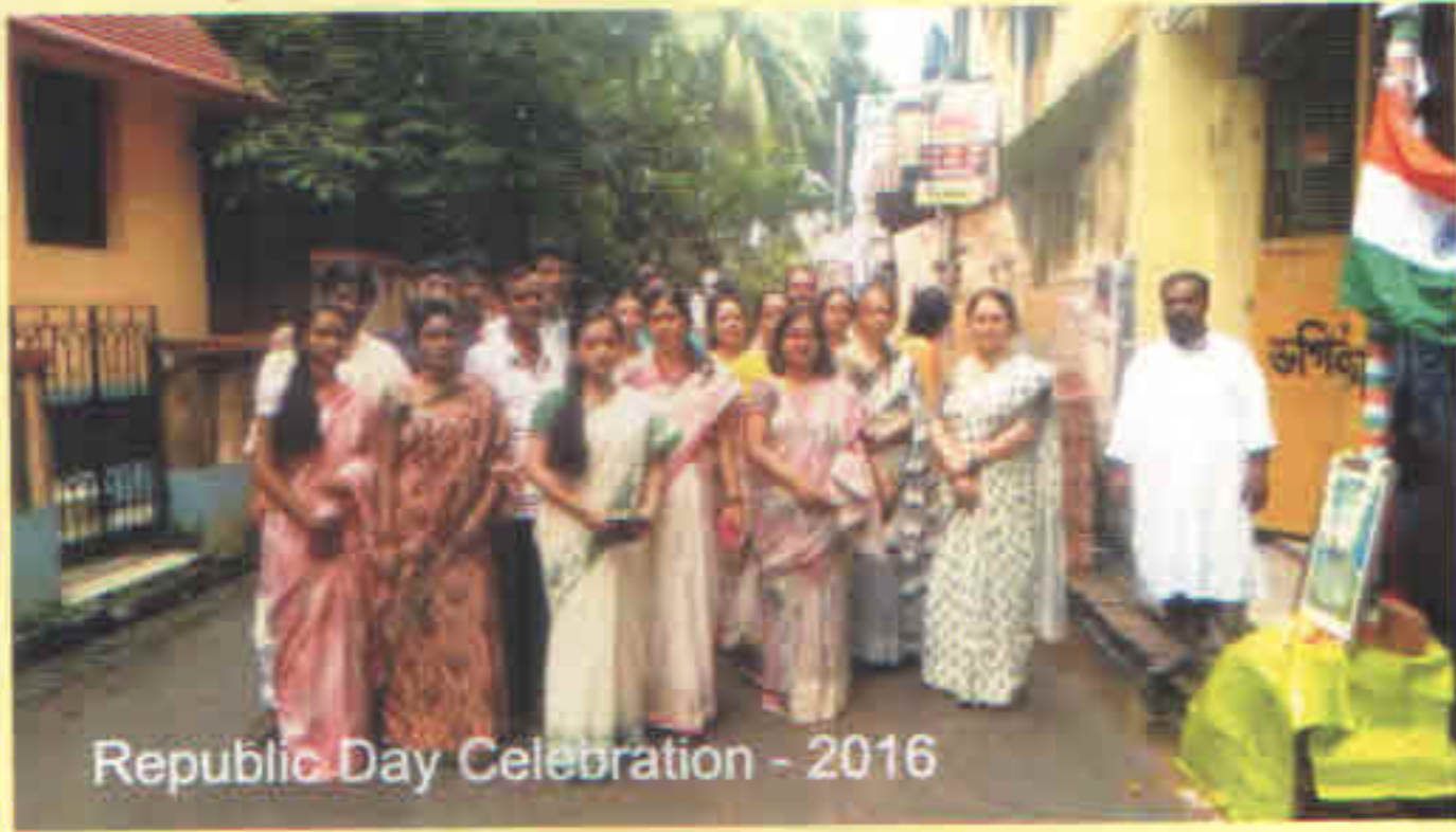
Republic Day Celebration - 2016