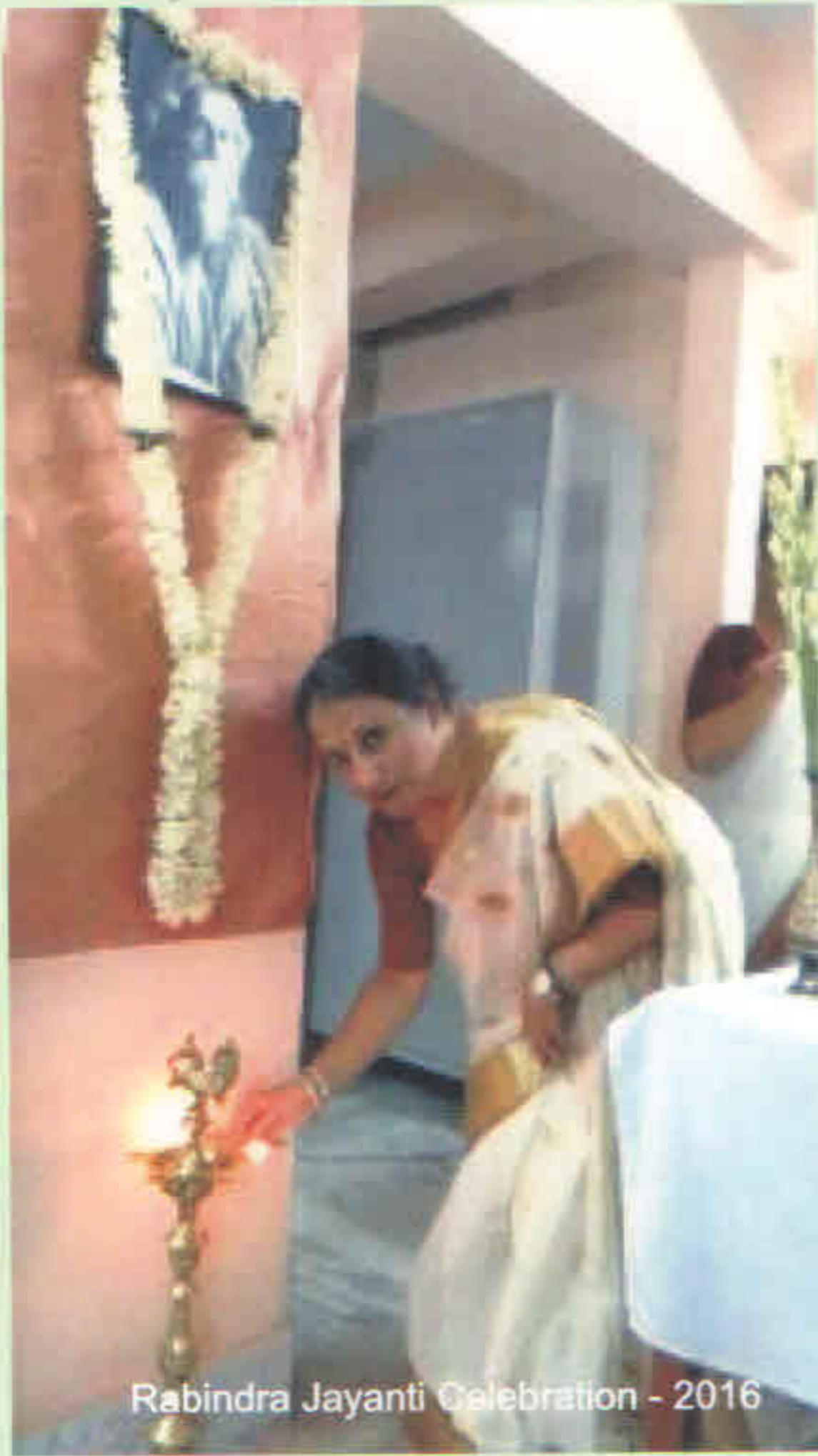
Rabindra Jayanti Celebration - 2016