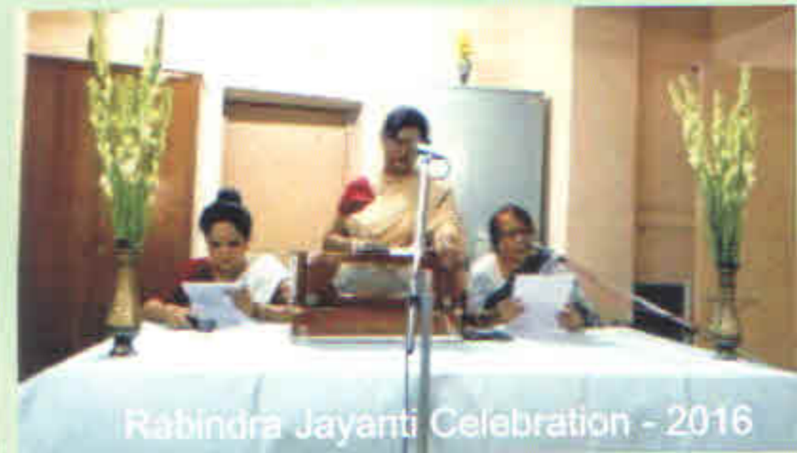
Rabindra Jayanti Celebration - 2016