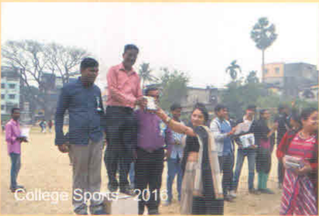
College Sports - 2016