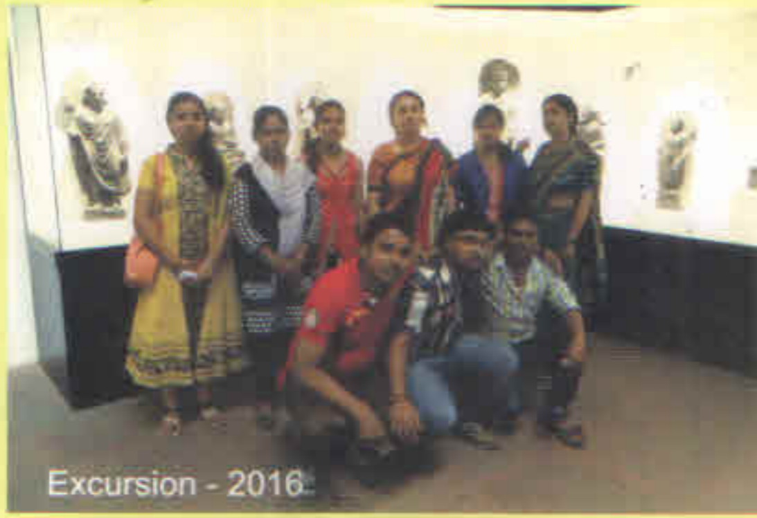
Excursion - 2016